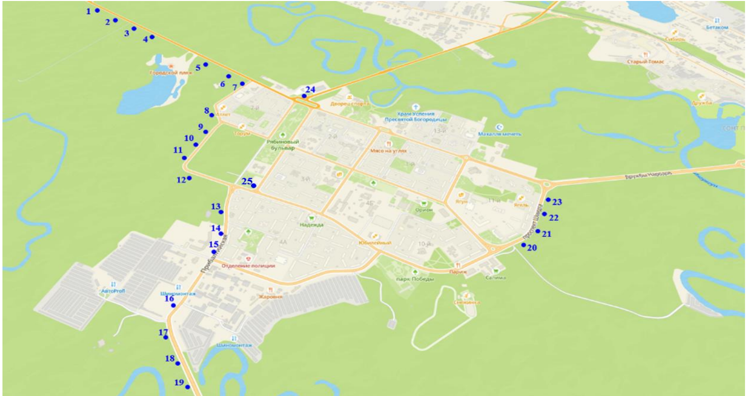
Схема размещения перспективных рекламных конструкций в правобережной части города Когалыма

Приложение 3 к постановлению Администрации города Когалыма от 05.07.2024 № 1286