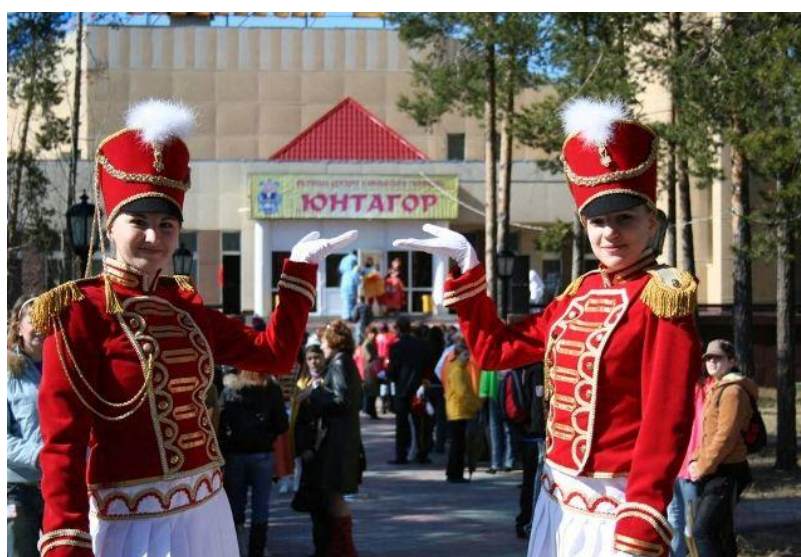
ФД. Оп.4. Д.270. Л.1 Открытие Городского фестиваля детского и юношеского творчества «Юнтагор» в Культурно-досуговом комплексе «Янтарь», 2007 год.