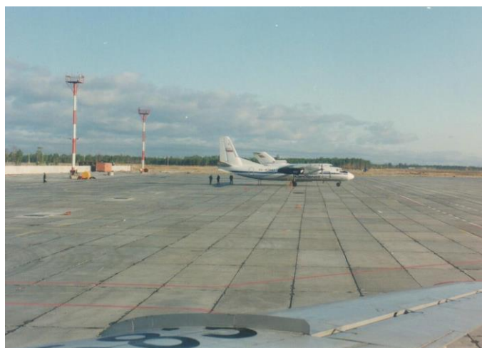
ФД. Оп.3. Д.1. Л.4. Общий вид аэродрома, 1993 год.