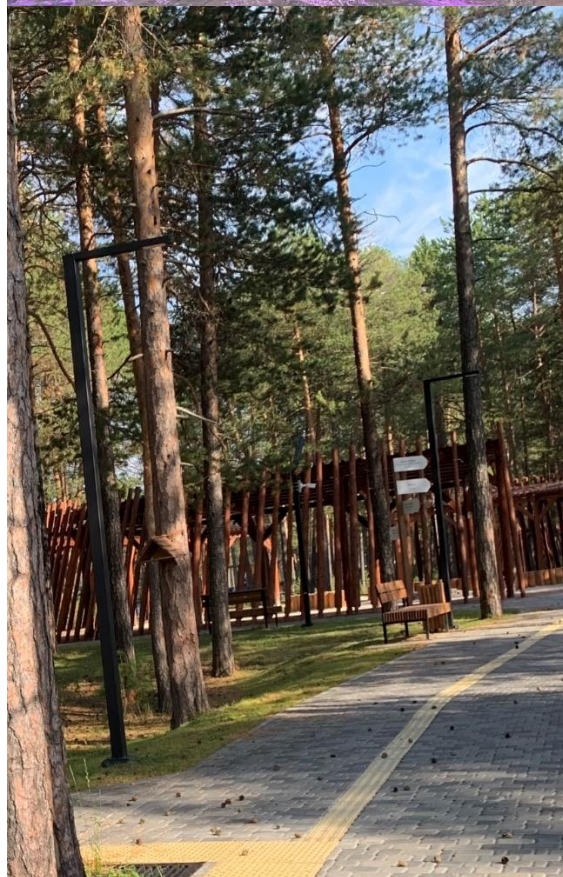
Архивный отдел Администрации города Когалыма.