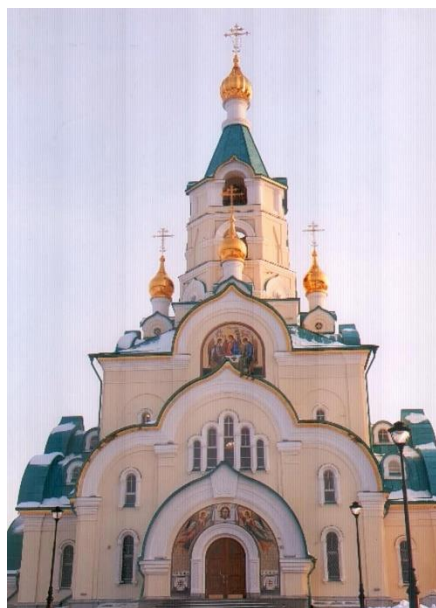
ФД. Оп.4. Д.329. Л.1 Общий вид храма святой мученицы Татианы, 2020 год.

Чин освящения храма совершил Патриарх Московский и всея Руси Кирилл 9 сентября 2018 года.