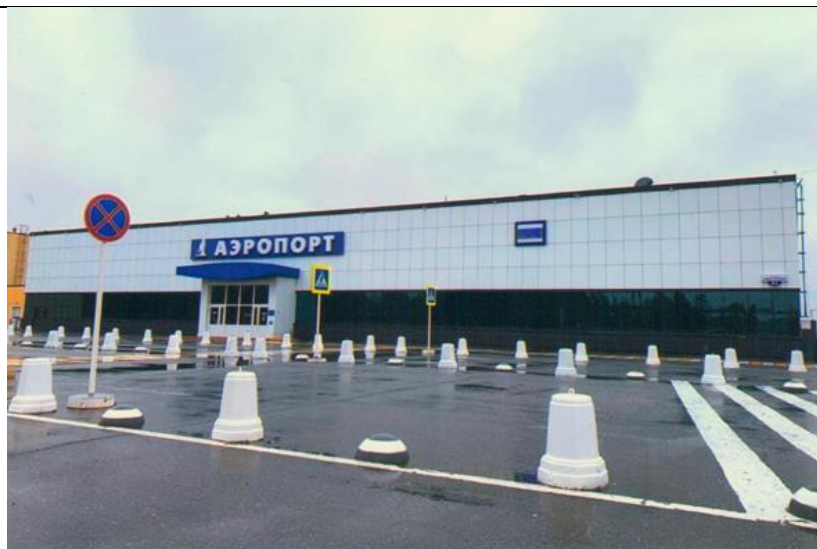
ФД.Оп.4.Д.435.Л.1 Общий вид здания Общества с ограниченной ответственностью «Международный аэропорт Когалым», 2021 год.