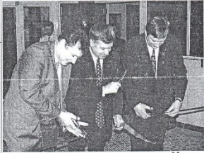
ДЕВЯТЬ ЭТАЖЕЙ "КОГАЛЫМНЕФТЕГАЗА"