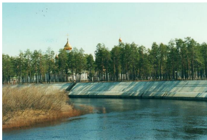
ФД. Оп.1. Д.82. Л.1 Общий вид набережной реки Ингу-Ягун в черте города, 2000 год.

объекта прекрасно освещена, защиту от вандалов обеспечивают восемнадцать камер видеонаблюдения и система «Безопасный город».