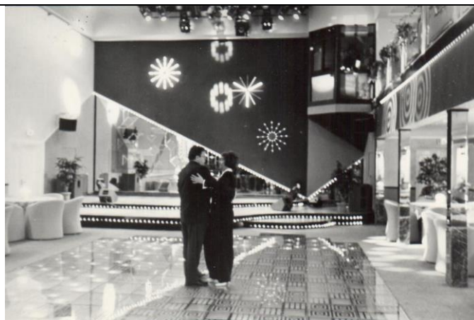
ФД. Оп.2. Д.31. Л.1 Общий вид «Музыкальной гостиной» киноконцертного комплекса «Янтарь», 1996 год.