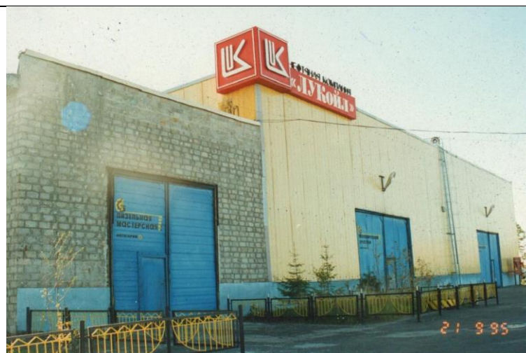
ФД. Оп.1. Д.42. Л.1. Общий вид здания дизельной мастерской НК «ЛУКОЙЛ», 1995 год.