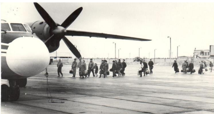
ФД. Оп.2. Д.12.Л.1 Взлетно-посадочная полоса Аэропорта г. Когалыма, 1993 год.

30 лет назад (1993) Товарищество с ограниченной ответственностью «Аэропорт Когалым» вышел из состава фирмы «Сургутавиа» и стал самостоятельным аэропортом (ныне – Общество с ограниченной ответственностью «Международный аэропорт Когалым»). Эту дату авиаторы считают днем рождения аэропорта. Самостоятельная деятельность аэропорта позволила расширить географию полетов. Таким образом было налажено сообщение с Москвой, Краснодаром, Тюменью и Минеральными Водами. Это были технические рейсы на самолетах Ту-134. Во второй половине 1993 года начали использовать аппарат типа Ту-154, который осуществлял перевозки в Сочи, Уфу, Казань и Самару. Вся деятельность аэропорта связана с его спецификой: обслуживание пассажиров, работающих вахтово-экспедиционным методом для освоения нефтяных месторождений в Когалымском районе, в том числе для НК «ЛУКОЙЛ»; перевозка народнохозяйственных грузов для нефтяников, жителей Крайнего Севера и Дальнего Востока; обслуживание коренного населения региона; деловая авиация.