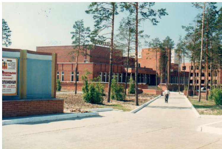
ФД. Оп.1. Д.16. Л.1 Общий вид кинотеатра «Янтарь» г. Когалыма, 1994 год.

После реконструкции здания в 2019 году здесь открыл свои двери Филиал государственного академического Малого театра России. Это стало огромным подарком как для когалымчан, так и для всех театралов Югры.