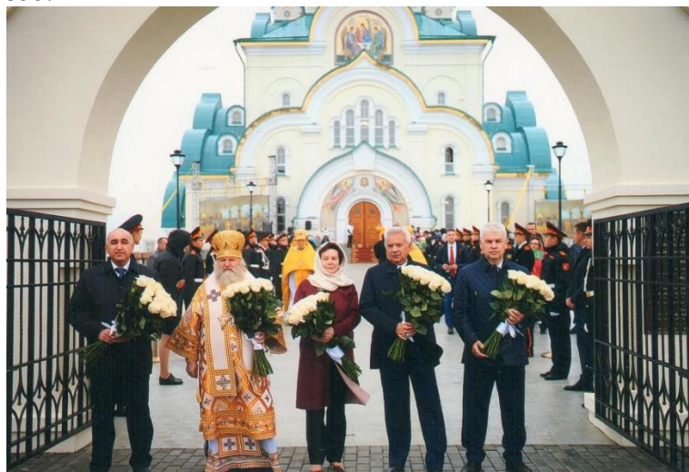
ФД. Оп.4. Д.323. Л.1 Торжественная церемония открытия храма святой мученицы Татианы.