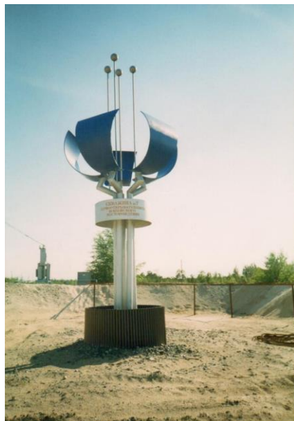
ФД.Оп.1.Д.281.Л.1 Общий вид стелы – «Скважина №7 Первооткрывательница Повховского месторождения», 2003 год.

пор Повховское месторождение – одно из значимых в ООО «ЛУКОЙЛ-Западная Сибирь». Оно стало стартовой площадкой для многих будущих руководителей нефтяной отрасли.