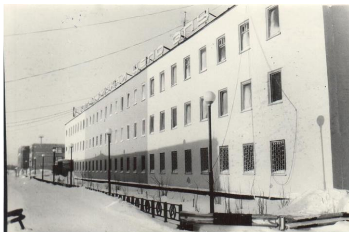
ФД. Оп.2. Д.46. Л.1 Общий вид здания Центральной базы производственного обслуживания электропогружных установок (ЦБПО ЭПУ), 1996 год.