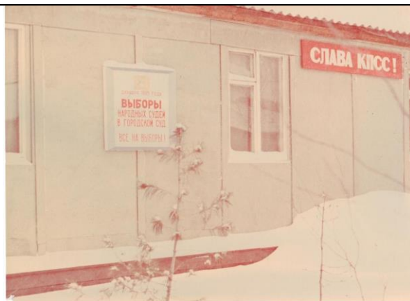
ФД. Оп.1. Д.181. Л.1 Здание Когалымского сельского Совета народных депутатов по улице Пионерной, 1 п. Когалым, 1985 год.