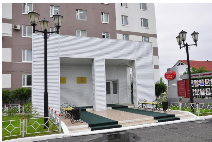
Архивный отдел Администрации города Когалыма. Ф.Р-56. Оп.1. Д.78. Л.45; Ф.Р-56. Оп.1. Д.78. Л.18.