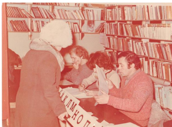
ФД. Оп.1. Д.177. Л.1 Члены участковой избирательной комиссии во время регистрации избирателей на выборах в местные Советы народных депутатов на избирательном участке, расположенном в помещении библиотеки Когалымского горкома КПСС, 1985 год.

40 лет назад (1983) была создана организация ветеранов войны (ныне – Городская общественная организация ветеранов (пенсионеров) войны, труда, Вооруженных Сил и правоохранительных органов).