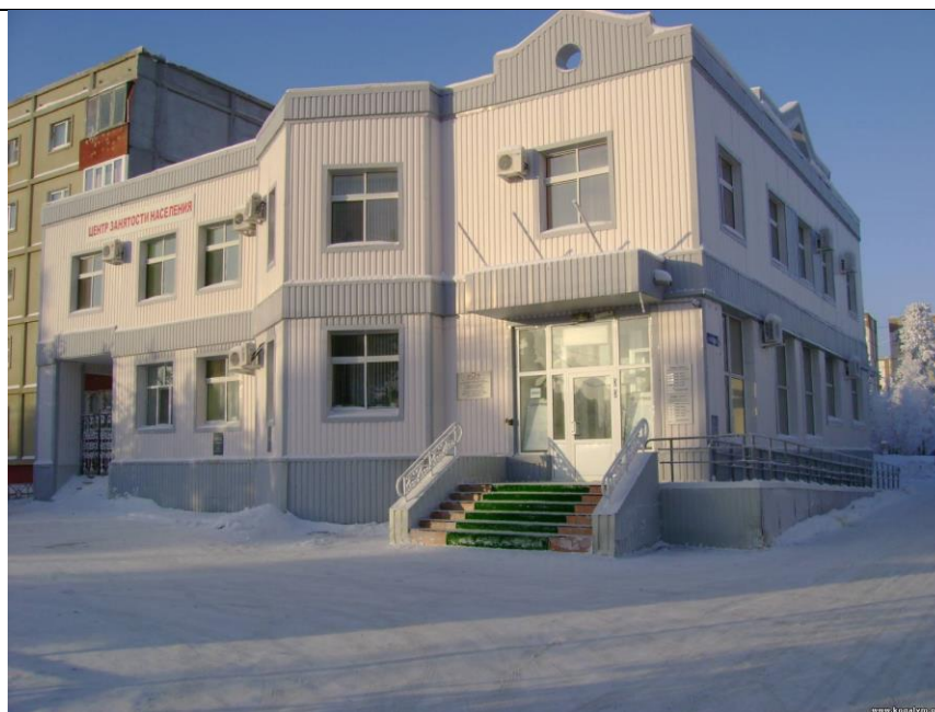
Архивный отдел Администрации города Когалыма.