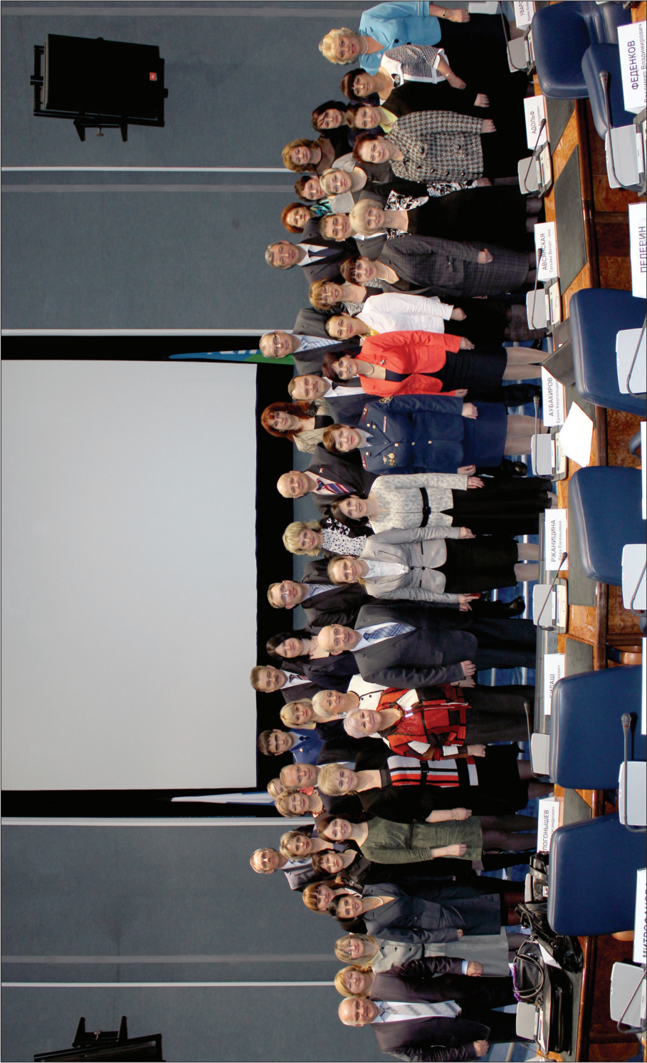
О принимаемых мерах при решении проблем, возникающих по профилактике безнадзорности и правонарушений несовершеннолетних