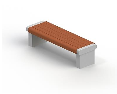
Скамья садово-парковая на железобетонных ножках