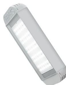
Ферекс ДКУ 07-130-50-Ш уличный светодиодный светильник