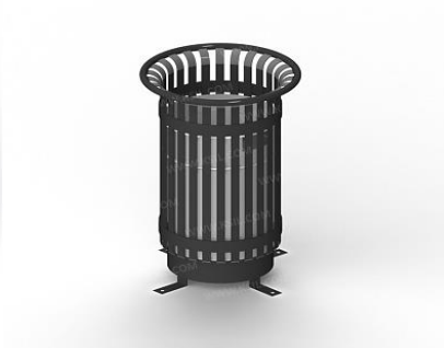
Урна металлическая с окрашенной вставкой