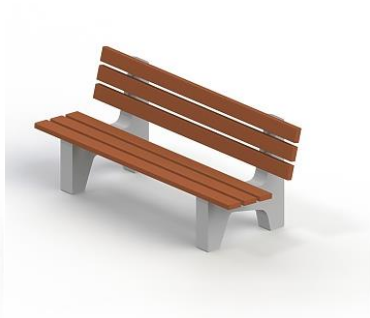
Диван садово-парковый на железобетонных ножках