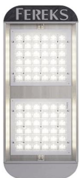
Ферекс ДКУ 07-156-50-Ш уличный светодиодный светильник