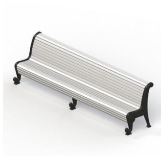
Диван садово-парковый на чугунных ножках