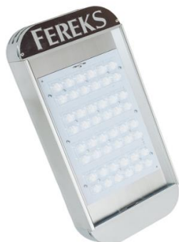
Ферекс ДКУ 07-104-50-Ш уличный светодиодный светильник